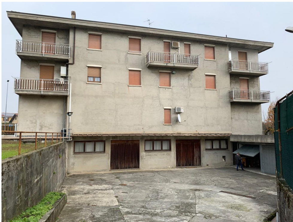
Facciata sul retro