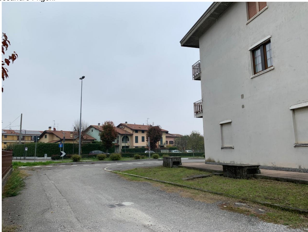
Strada privata e facciata laterale