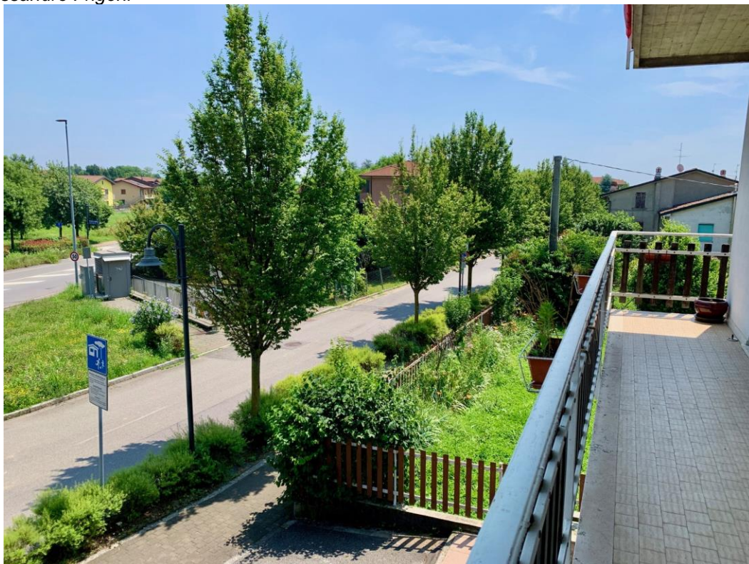
Balcone del soggiorno