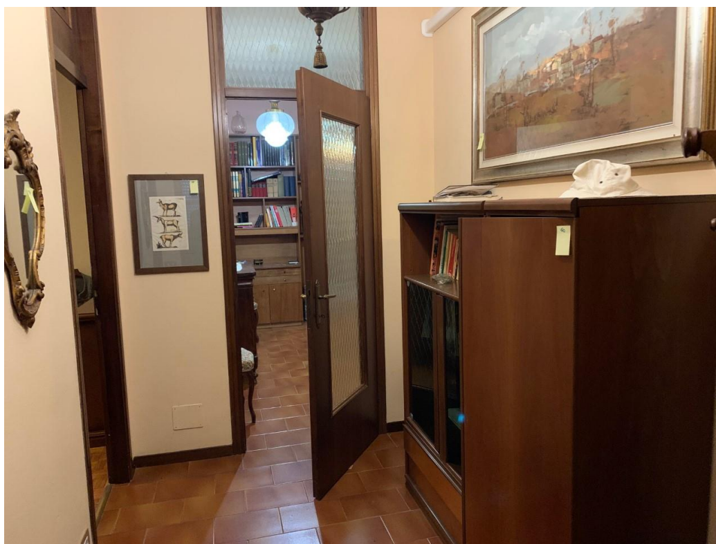
Disimpegno zona notte